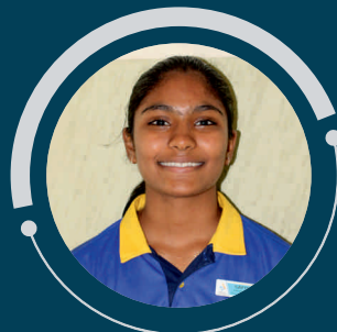
Impana (Class 11B)